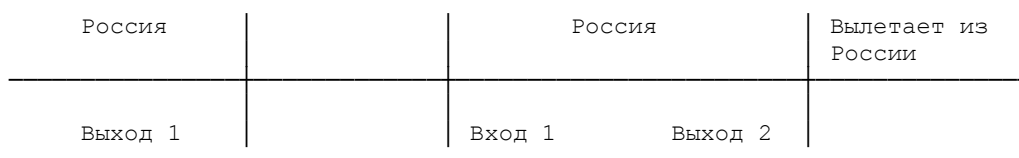
Рисунок 1.2 (б)